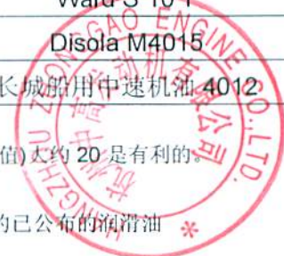
表 3. MAN 公司四冲程发动机用轻柴油和柴油运行的已公布的润滑油